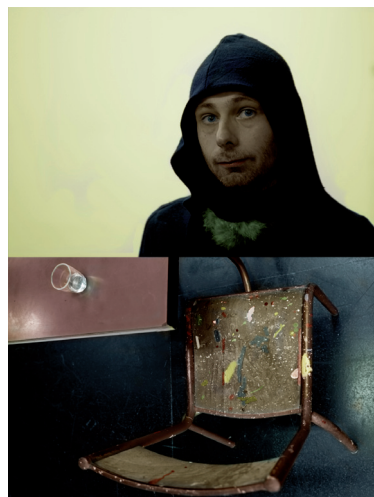
Damien Guillaume, série Fenêtres sur scène , 2011